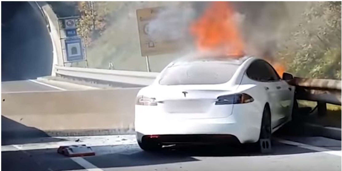
Abbildung 1: Brandbekämpfung bei Lithium-Ionen-Akkus

Fachausschuss Vorbeugender Brand- und Gefahrenschutz und Fachausschuss Einsatz, Löschmittel und Umweltschutz der deutschen Feuerwehren