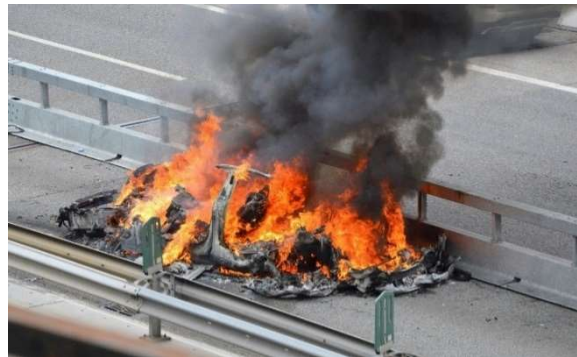
Abbildung 3: Brand eines E-Autos nach einem Unfall im Kanton Tessin