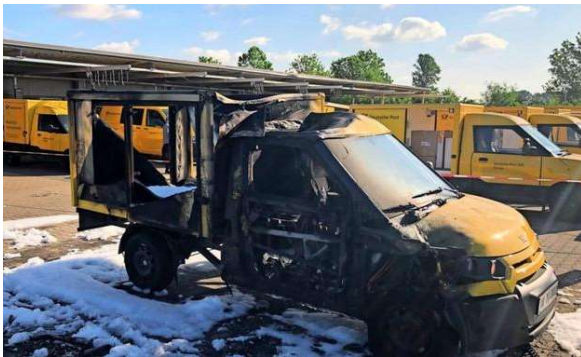
Abbildung 2: Brand eines E-Lieferwagens

Bei Bedarf (z. B. Flüssigkeitsbrand durch auslaufendes Benzin) kann der Einsatzleiter den Einsatz von Löschmittelzusätzen anordnen. 9 Wird Schaummittel verwendet, dann sollte dieses fluorfrei sein. Mögliche Auswirkungen auf die Umwelt sind in jedem Fall durch die Einsatzleitung zu berücksichtigen.